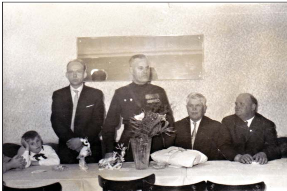
Obrázek 2: Návštěva ze SSSR. Příbuzní v Medlovicích padlých sovětských vojáků

28. 11. 1973 přivítali občané početnější delegaci ze SSSR. K tomuto datu byla na pomník umístěna deska se jmény v Medlovicích padlých vojáků RA.