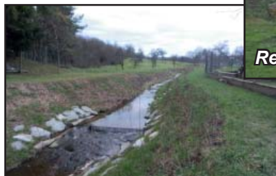
Břehy potoka – upravené, které si u zahrad občané sami udržují