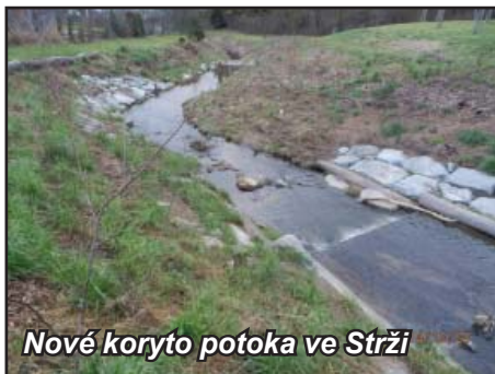
Nové koryto potoka ve Strži