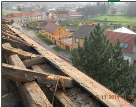
Po demontáži plechové krytiny