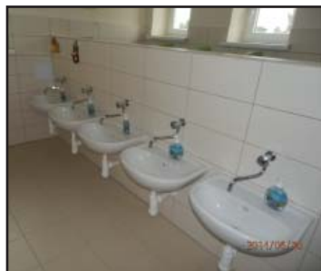
Nové sociální zařízení mateřské školy