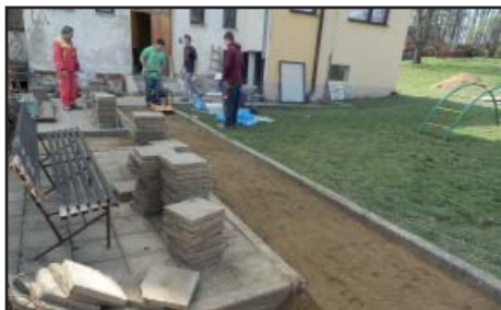
Oprava chodníku před obecním úřadem