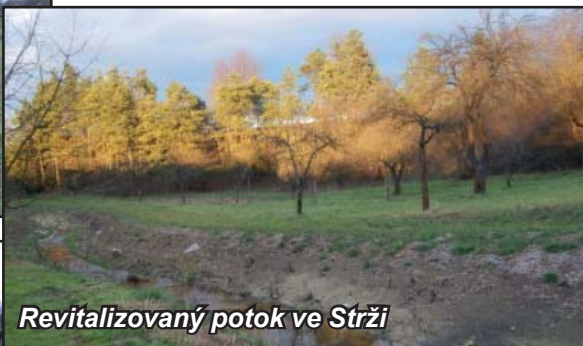
Revitalizovaný potok ve Strži