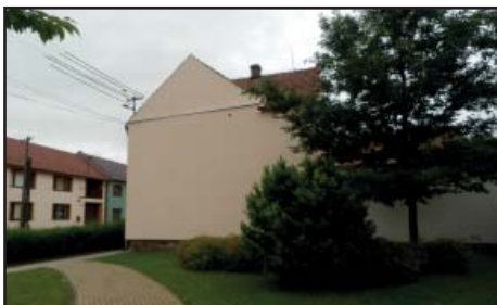
Bytový dům č. p. 11