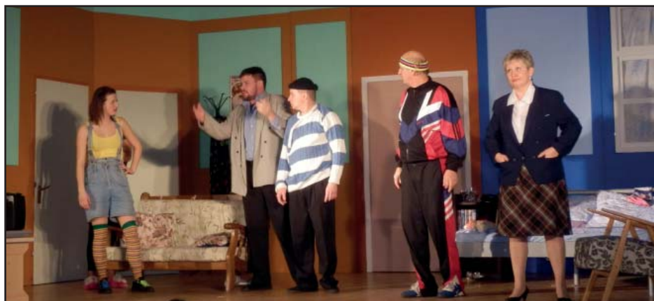
Foto z představení 18. 1. 2014