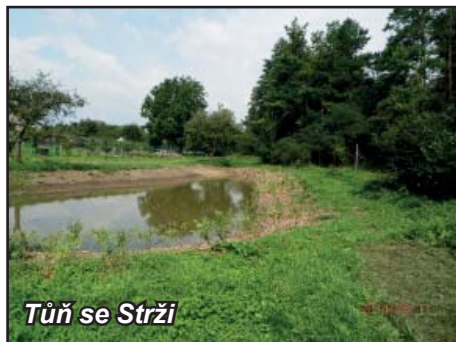
Tůň se Strži