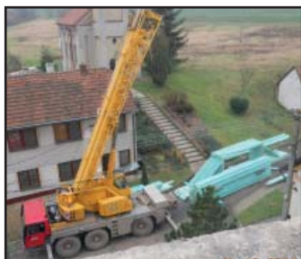
Převaha vazby jeřábem