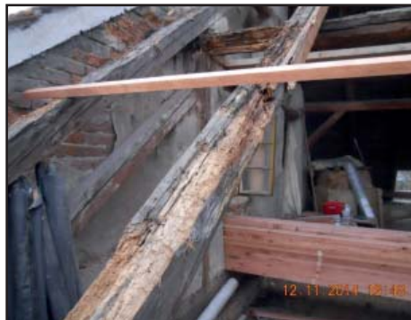
Stav dřevěné konstrukce